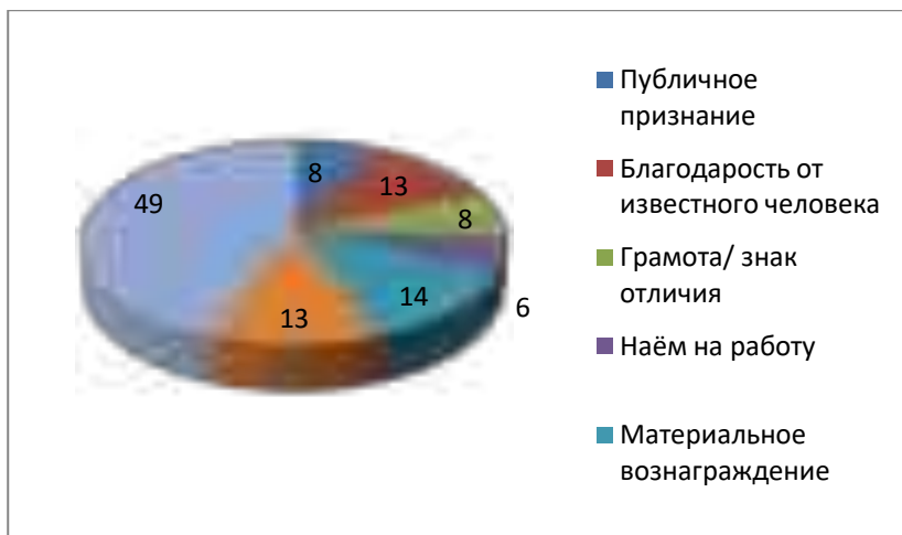
Рисунок 2. Диаграмма «Что привлекает в волонтерском движении»

На вопрос «Хотели бы вы заниматься волонтерской деятельностью?» респонденты дали ответы: да, я уже занимался (-лась) и буду продолжать – 8 ; еще не занимался (-лась), но хочу заняться – 31 ; уже занимался (-лась), но не собираюсь продолжать – 9 ; затрудняюсь ответить – 41 .